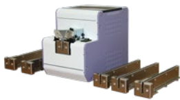
R-NSB Schraubenspender in der Standardausführung