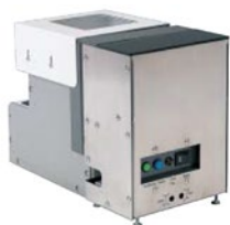
R-NJ-80 mit R-NJR