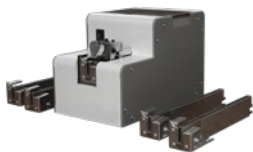
R-NJ Standard Schraubenspender in der Standardausführung