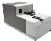
R-NJR Automatik Version für Schrauber mit Vakuumvorsatz und Saughülse (für handgeführte Schrauber oder Roboterschrauber)