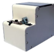
R-NSR Automatik Version für Schrauber mit Vakuumvorsatz und Saughülse (für handgeführte Schrauber oder Roboterschrauber)