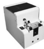
R-NSRI Automatik Version für Schrauber mit Vakuumvorsatz und Saughülse (für handgeführte Schrauber oder Roboterschrauber)