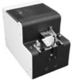
R-NSBI Schraubenspender in der Standardausführung

Das neue Zuführsystem kann drei Schrauben bereitstellen.